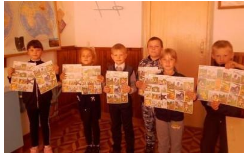
Распространение памяток по ПДД