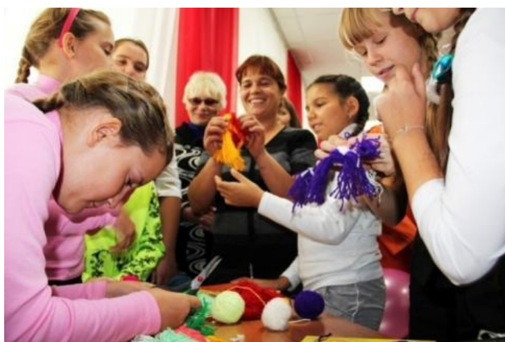
/МБОУ «Кулундинская средняя общеобразовательная школа № 5»