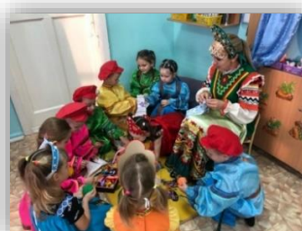
Рис. 2. Фотоколлаж практик работы по гражданско-патриотическому воспитанию в МБДОУ «Детский сад №56» г. Барнаула