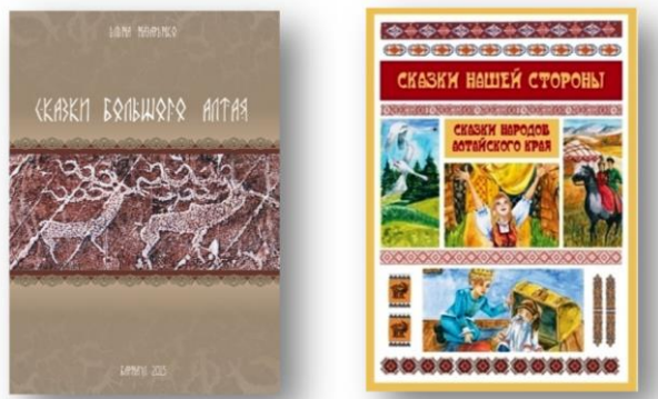
Рис. 1. Примеры сказок в издательских проектах: региональный компонент

Это сложно, но есть прекрасный инструмент, который помогает, – мостик между педагогами и детьми – это сказка и, в том числе, сказка с точки зрения региональной принадлежности, сказки разных народностей. Этот инструмент можно назвать адаптированным вариантом рупора мифологической парадигмы. Такой метаинструмент способен стать базовой основой любого содержания образовательной деятельности (рис. 1).