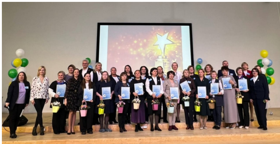
Руководители образовательных организаций — участники проекта «Школа доброжелательных отношений» 2022 и 2023 гг.