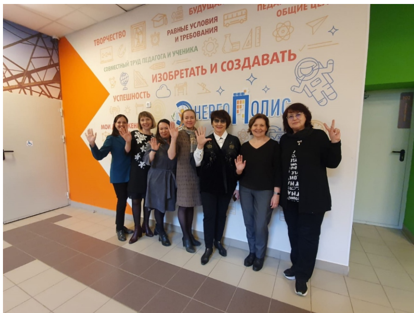
Команда экспертов проекта «Школа доброжелательных отношений»